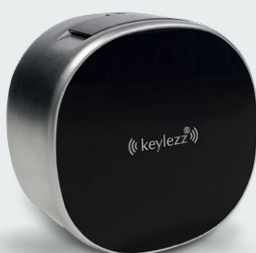
Keylezz® Turn Multiflex Der Alleskönner

Keylezz® Turn – in weiteren Varianten erhältlich