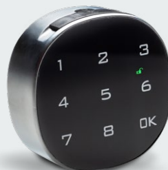
Keylezz® Turn PIN 4-stelligen Code vergeben