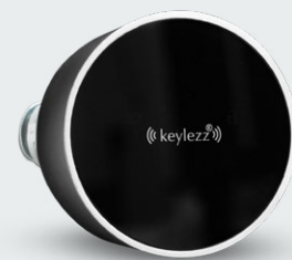
Keylezz® Turn Mini Smart Bedienung per App