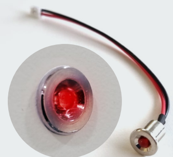
LED zur Ansicht des Belegstatus