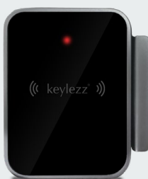
Keylezz® Außenantenne mit LED-Anzeige und Notbestromung