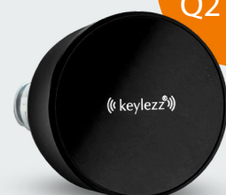
Keylezz® Turn Mini Die smarte Lösung